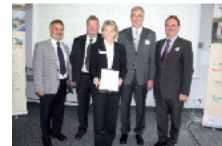
Übergabe des 100. Förderbescheides an die EurA-Consult GmbH aus Ellwangen am 24.09.2010