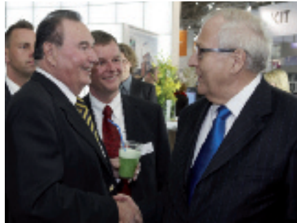
Bundesminister Brüderle besucht den ZIM-Stand auf der Hannover-Messe 2010

Mit rund 150.000 Besuchern aus 71 Ländern, davon circa 93 % Fachpublikum, ist die Hannover-Messe das weltweit wichtigste Technologieereignis und Entscheidungszentrum, wenn es um Investitionen in internationale Märkte