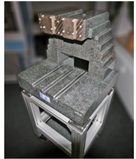
Schwingungsarmes C-Gestell einer Sondermaschine aus Granit-Schichten